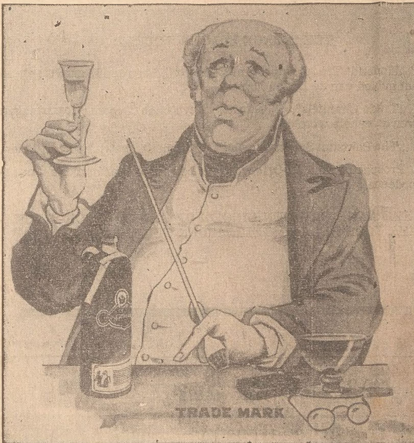
Hulstkamp Z. O. Genever en Likeuren Agent: Witcom. Keukenstraat 7-11 Tel. 1991.